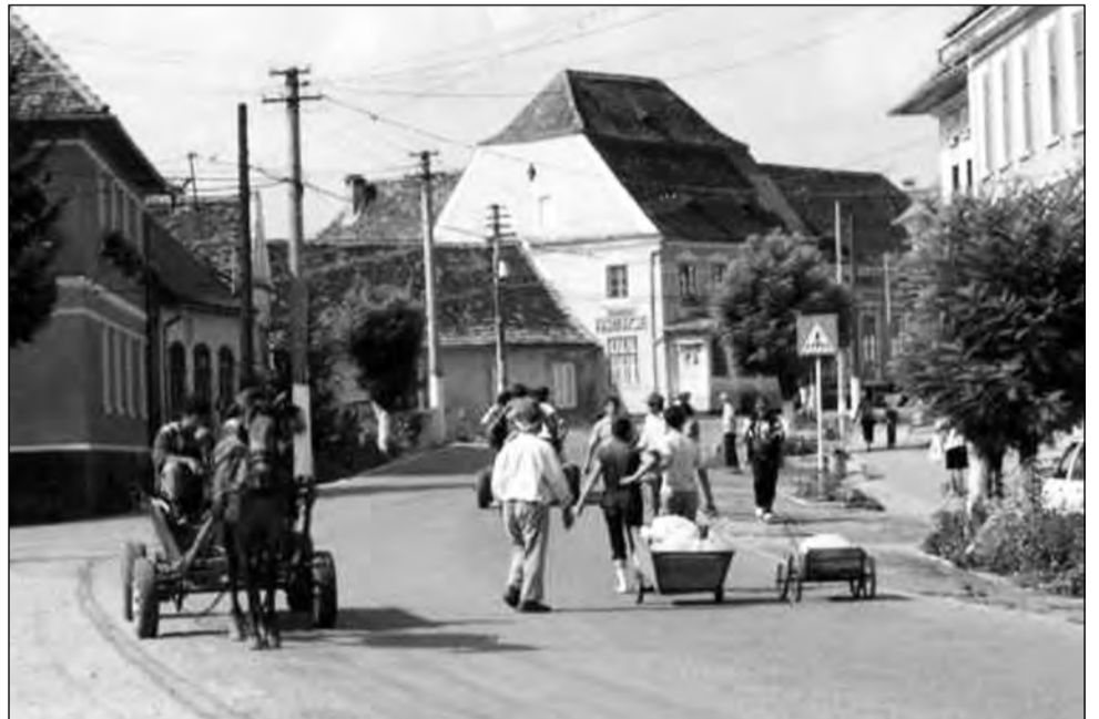
Rămâne un mister cum va reuși administrația locală să-și plătească datoriile