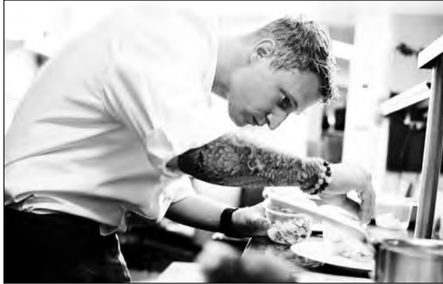
Cursurile se adresează celor interesați să învețe o meserie nouă

După parcurgerea programului de formare, cursanții primesc un certificat de absolvire și calificare emis de că-