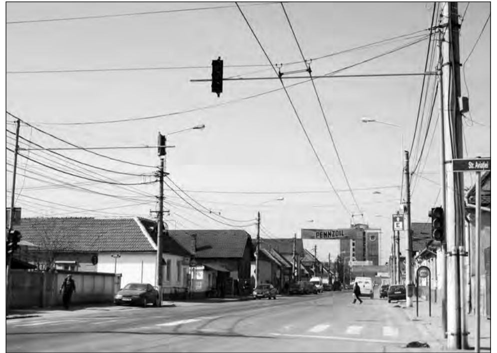
Municipalitatea vrea să reducă facturile pentru iluminatul public prin modernizarea rețelei

Societatea care se va ocupa de iluminatul public în Mediaș va avea drept obiectiv principal îmbunătățirea sistemului de iluminat public. Acest lucru ar putea fi posibil prin creșterea eficienței rețelei. Totodată, municipalitatea dorește să facă economii la buget și să aibă propus ca factura pentru iluminatul public să scadă cu